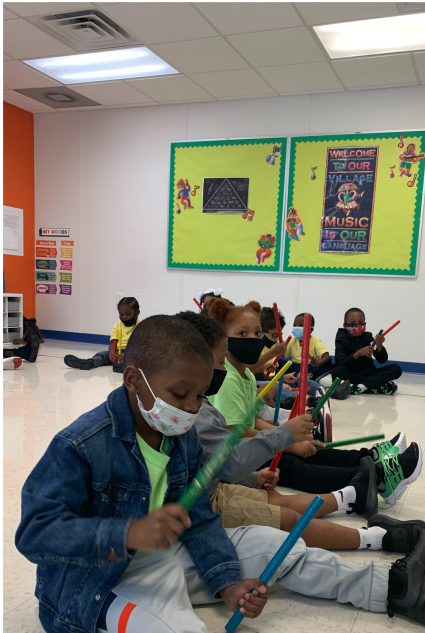
Estudiantes de la clase de musicalidad mantienen el tiempo con baquetas rítmicas en la escuela Patterson Park Public Charter School (PPPCS)