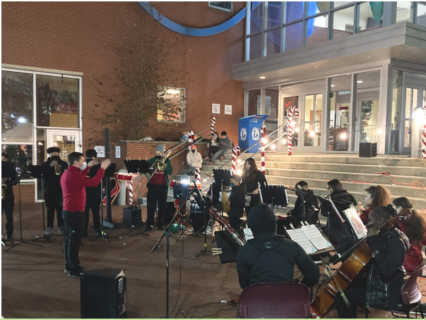
Ensamble Latino presentándose en el Highlandtown Art Walk